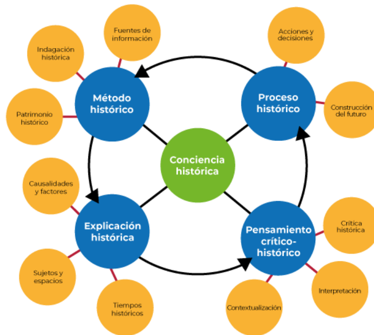
Diagrama de categorías y subcategorías

con los hechos y procesos ocurridos en el tiempo, desde una perspectiva comunitaria, regional, estatal, nacional y global. Se ubican y asumen como sujetos históricos que conforman un proceso en desarrollo.